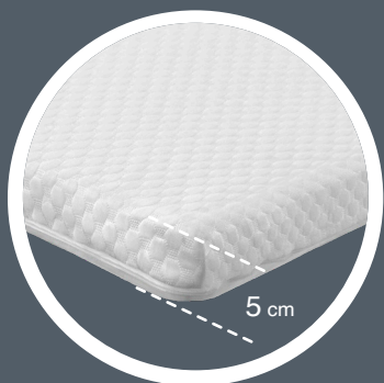
2 Morphée+ épaisseur : 5 cm

Ici : un matelas et un sur-matelas Morphée+